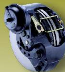
ZESTAWY NAPRAWCZE ZACISKÓW HAMULCOWYCH