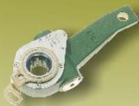
D WIGNIE ROZPIERAKA