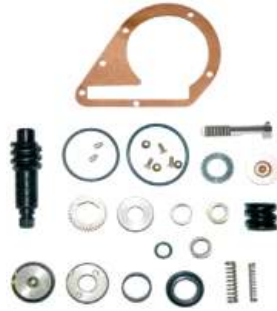
Zestaw naprawczy d wigni automatycznej