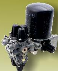
PNEUMATYKA, ZAWORY I ZESTAWY NAPRAWCZE