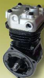
KOMPRESORY I CZ CI ZAMIENNE