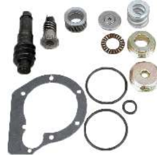
Zestaw naprawczy d wigni automatycznej typu S-ABA